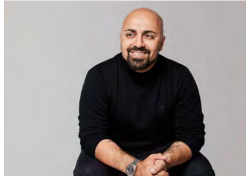
Ali Mahlodji Speaker & Impact-Entrepreneur / futureOne

Ein Leben wie ein Drehbuch: Der visionäre Traum vom Walliser Bergbub, der steile Weg bis ganz an die Weltspitze, der brutale Absturz ins bodenlose Nichts.